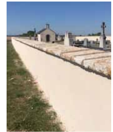
Enduit réalisé sur la totalité du muret et de la chapelle.