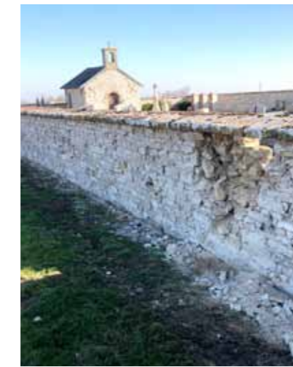
Le muret extérieur du cimetière après piquetage de l'ancien enduit.

En concertation, les membres du conseil projettent diverses options pour clore le hangar municipal porteur des panneaux photovoltaïques. À ce jour, aucun projet n'a été retenu, la consultation de plusieurs entreprises est actuellement engagée. Dans le cadre de cet aménagement, il est également prévu un lot qui verra la réfection et la finition par un enduit des murs et pignon existants de cet édifice.